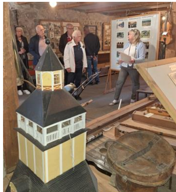
Här får deltagarna ta del av intressanta historier om Björklings välkände bygdespelman "Gåsanders" som även har hedrats med en staty nedanför kyrkan utefter väg riks 13 numera väg 600.