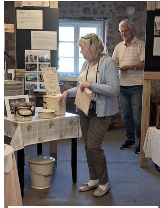
I museets tidsepokutställning fick vi följa när de olika materialen började användas i hemmen som också kom att påverkade och förenklade vårt levnadssätt.