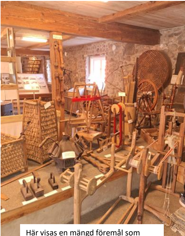
Här visas en mängd föremål som användes vid garnframställning inkl. vävutrustning