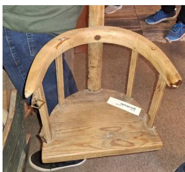
Inomhusgunga för de mindre i familjen kunde hängas i köket, som underlättade för husmor när hon hade fullt upp med matlagning till ofta den stora familjen.