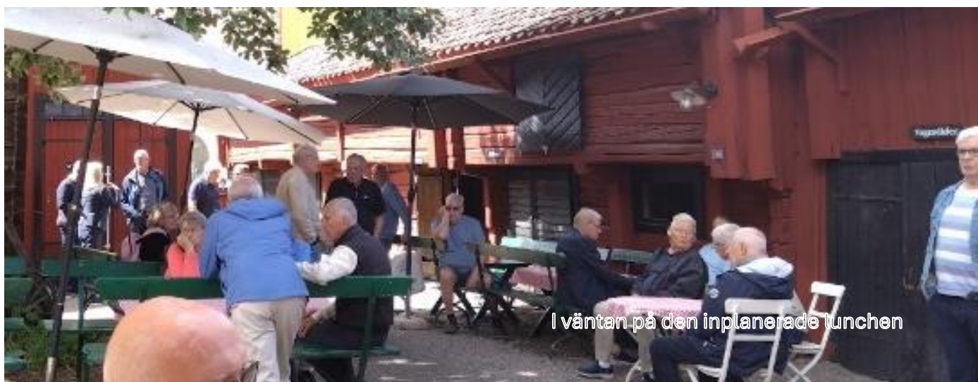
I väntan på den inplanerade lunchen