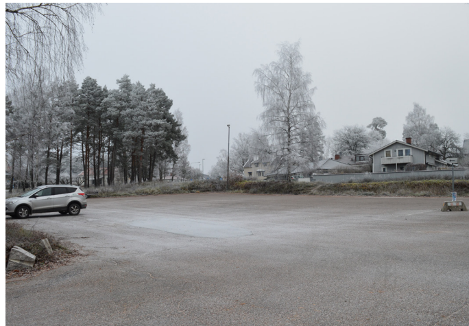
Stora parkeringen vid Skarholmen

Intill Lurbo bro finns en parkering för 4 bilar. Härifrån kan du promenera längs trottoaren på andra sidan vägen uppför backen. Strandpromenaden börjar med en slingrande träspång intill trottoaren.