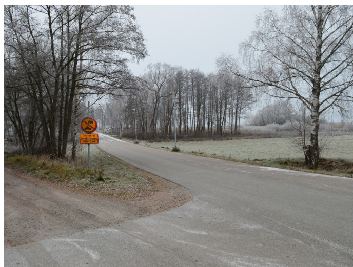
Bilvägen mot strandpromenaden