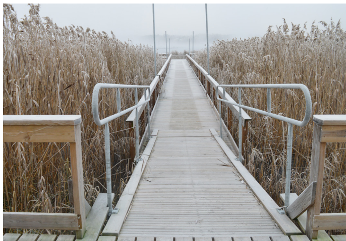
Rampen ner till det bredare trädäcket