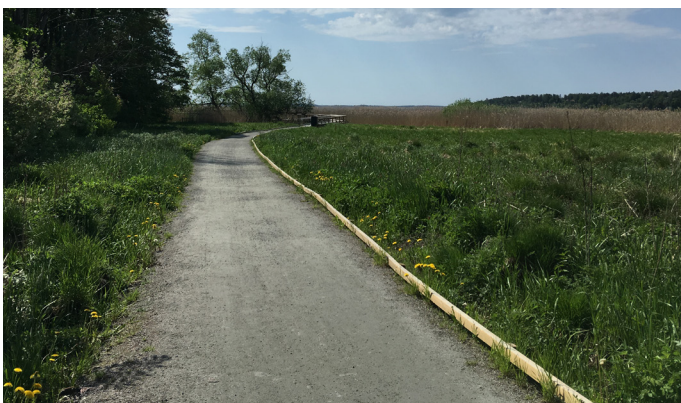
Bred grusstig med en kantlist bredvid