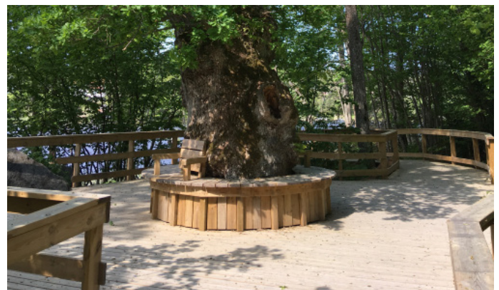
Bänkar längs spången med plats för rullstol bredvid