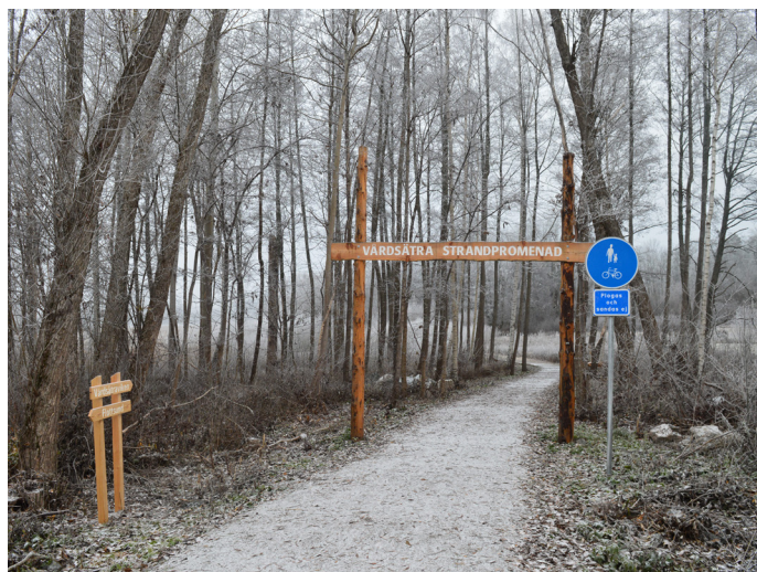
Strandpromenadens start vid Skarholmen

Från parkeringen vid Lurbo följer du trottaren uppför backen tills du ser ingången till strandpromenaden på vänster sida. Strandpromenaden börjar med en slingrande träspång intill trottoaren.