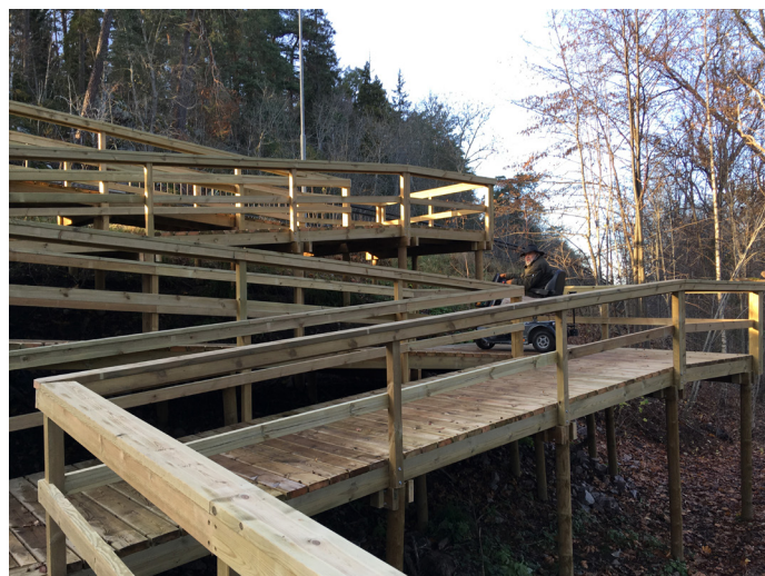
Den slingrande spången vid Lurbo.