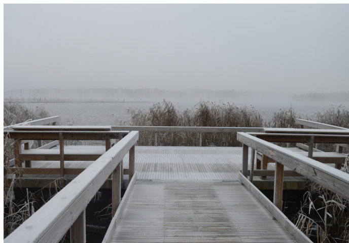
Det bredare trädäcket