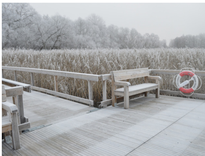
Bänkarna på däcket