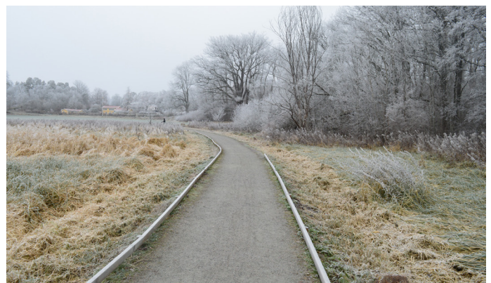
Bred grusstig med två kantlister